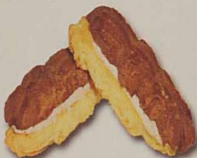
День и ночь