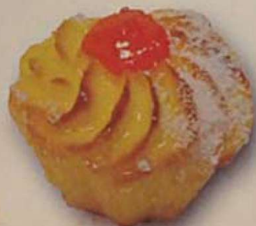
Пудинг с клубникой

печенье в форме ракушки с начинкой крем-брюле, клубники, киви